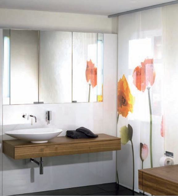
SGG MIRASTAR als feuchtraumbeständiger Chromspiegel im Nassbereich