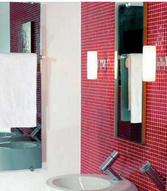
SGG MIRASTAR als Wandheizkörper SGG THERMOVIT elegance mit Handtuchhalter